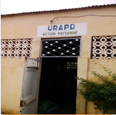
SIEGE DE L' URAPD